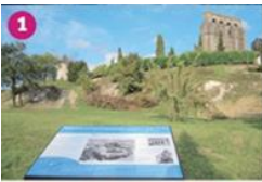
OBSERVATION DES COTEAUX DE TOURTRÈS Initez-vous à la lecture de paysage grâce aux cinq tables d'orientation qui vous offre Tourtrès pour comprendre l'évolution des paysages et des végétaux au fil du temps. Tourists enjoy the tables of orientation in order to help you understanding country's landscape.