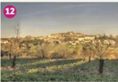
VERTHEUIL D'AGENAIS Découvrez ce joli village bâti dans les cailloux. La place des accolés des lieux vous mène jusqu'à l'église paroissiale des XII e et XIII e siècles. Discover this pretty village in the hills and its church dated from XII and XIII centuries.

Office de Tourisme Lot-et-Tolzac Place des Tanneiers - 47100 LE TEMPLE-SUR-LOT Tél. +33 5 53 41 86 46 ou +33 5 53 84 82 48 Office de Tourisme Lot-et-Tolzac www.tourisme-coeurdelotgaronne.fr