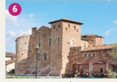
LA COMMANDERIE TEMPLIÈRE Laissez-vous conter l'histoire de ce bâtiment remarquable par un Raconteur de Pays. Poursuivez votre visite par la découverte des maisons à pans de bois de la bastide du Temple sur Lot. Let you tell the History of the Templar Commandery by a local guide, and watch around the fortified town in its topographical frames.