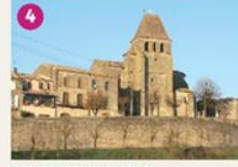
BASTIDE DE SAINT-PASTOUR Construite sur un rocher calcaire à 105 mètres de hauteur, la bastide de Saint-Pastour a conservé les vestiges de sa défense tels que le chemin de ronde. Discover this fortified tower built on to 105m and the remains of the its defensive part.