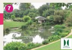
JARDIN DES HÉNUAPHARS LATOUR-MARLIAC 3 hectares de bosons et de jardins classés «Jardin Remarquable» diffèrent à vous. Découvrez le pont japonais, la serre ou encore la cascade et enfin vous pour un restaurant gastronomique Café Marliac. This 3 hectares remarkable garden offers you more than 200 varieties of waterfalls. You can also have a break in the restaurant.