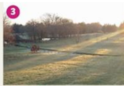
GOLF DE BARTHE Le Golf de Barthe à Tombereuf vous séduira par son cadre exceptionnel. Le Club House et sa terrasse donnent sur le terrain de golf de 9 trous. You want to play golf ? Let's come to the 9 holes golf course of Tombereuf!

Office de Tourisme Lot-et-Tolzac Place des Tanneiers - 47100 LE TEMPLE-SUR-LOT Tél. +33 5 53 41 86 46 ou +33 5 53 84 82 48 Office de Tourisme Lot-et-Tolzac www.tourisme-coeurdelotgaronne.fr