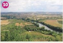
VISITEZ LAPARADE AVEC UN RACONTEUR DE PAYS Bastide militaire fondée en 1246, Laparade offre une vue panoramique sur la Vallée de Lot. Suivez le Raconteur de Pays pour en connaître tous les secrets. Founded in 1246, Laparade offers you a fantastic view on the Lot Valley. Let's discover its secrets with a local guide.