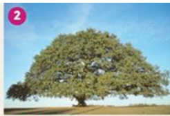
CHÊNE DE TOMBEREUUF Vieux d'environnement 250 ans, le Chêne de Tombereuf fait la fierté du village. Avec ses 35 mètres d'évergare, il a été labellisé «Arbres Remarquables de France» en 2013. The Oak of Tombereuf is 250 years old and large-scale 35 meters. Since 2013, it is a remarkable tree.