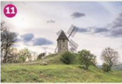
MOULIN DE COULX Moulin à tour cylindrique, dont d'elles à enlaiser, construit en 1779. Restant en 2013, il est un des derniers moulins encore actifs du département et dernier au village. Built in 1779 and rebuilt in 2003, the windmill of Coulx is one of the last in use national in the department.