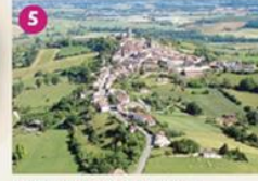
BASTIDE DE MONCLAR D'AGENAIS Proche à 167 mètres d'altitude, la bastide de Monclar vous offre une vue imprenable sur la Vallée du Lot. Découvrez le circuit des puits anciens, le lavoir ou encore la Halle-Mairie. This bastide have presents a stunning view ! Beils are marking out the shape of village.