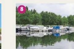
LA PLAGE ET LE PORT LALANDE La plage de Castelmoron est à la fois lieu de baignade et d'activités nautiques où l'équipe de Nautiques SAS vous attend pour une belle et calme Pique nique au Port Lalande pour embarquer à bord de «Le Vent d'Océan» le temps d'une croisière ! Les plus sportifs emprunteront la Voie Verte pour une visite à vélo. Let's enjoy the Lot river at Castelmoron ! Swimmers, taking a canoe from the beach, or cycling: What, you prefer cycling on the Voie Verte ?